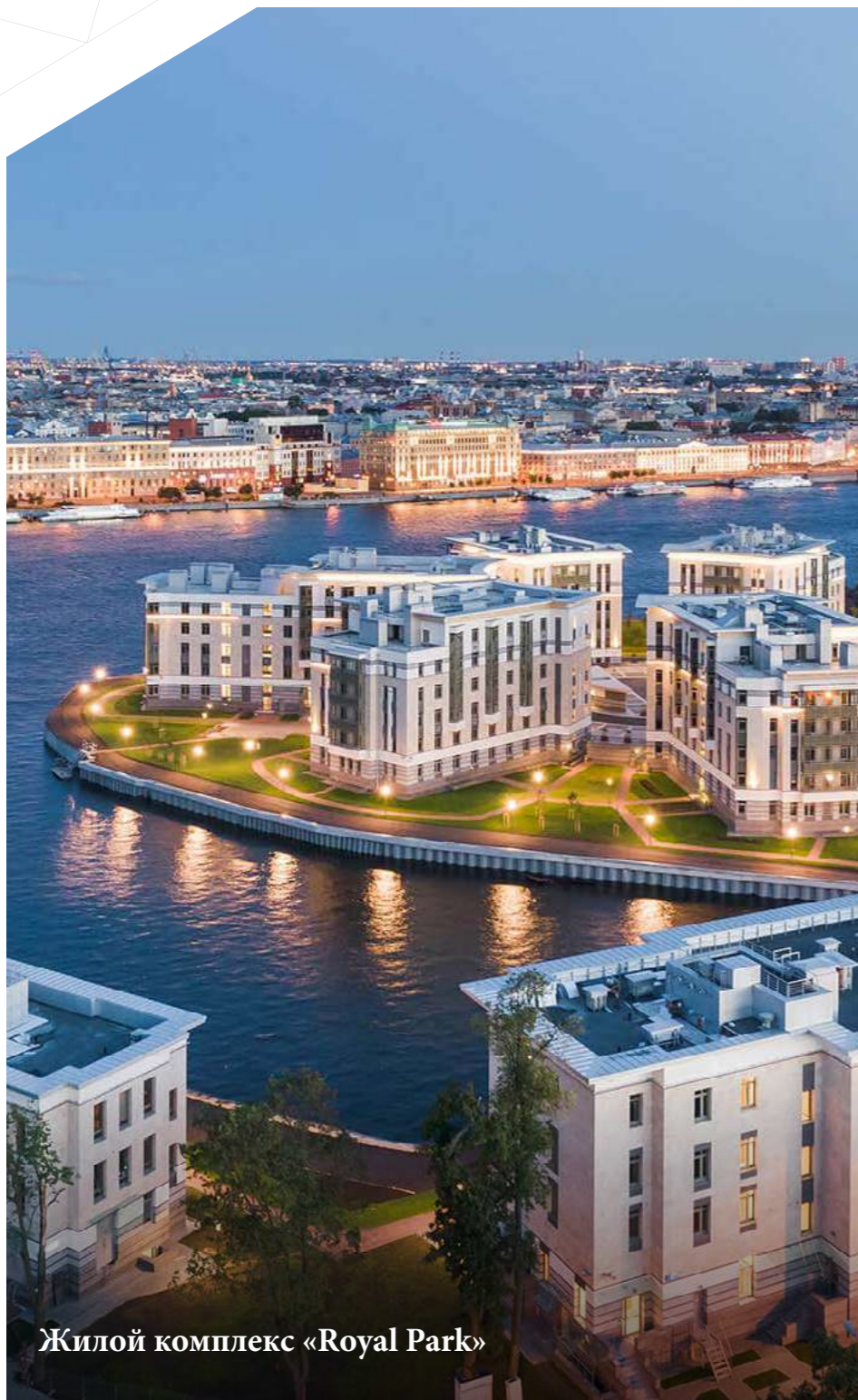
Жилой комплекс «Royal Park»

Приемка квартиры, дизайн-проект, отделка, сдача в аренду, зачет и продажа недвижимости.